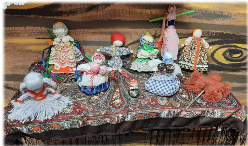
Выставка народной куклы-оберега