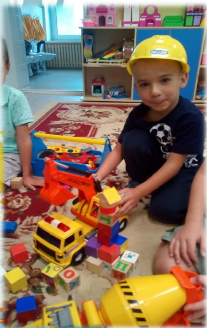
Сюжетно-ролевая игра «На стройках города»