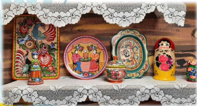
В рамках нашего мини-музея проводилась выставка «Ремесла Урала»