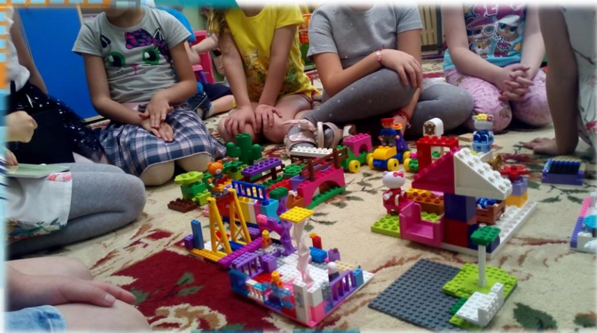
«Наш любимый парк»