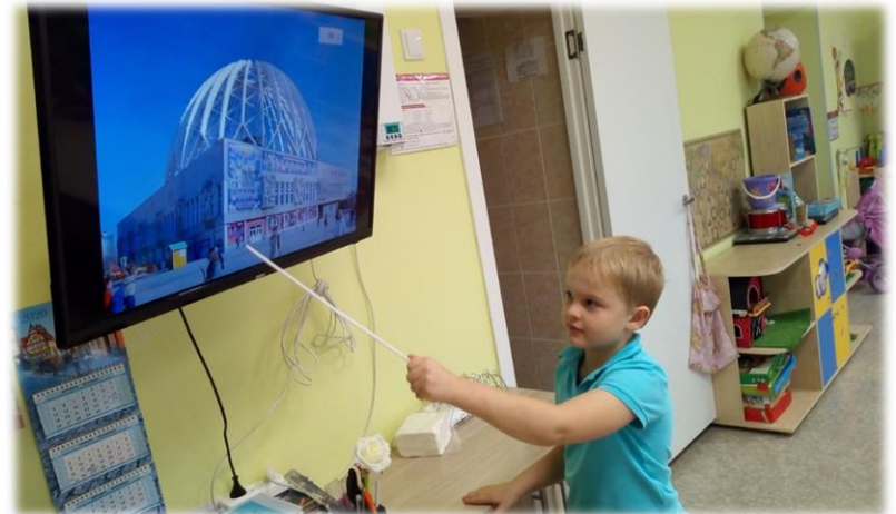
Рассказы о Екатеринбурге