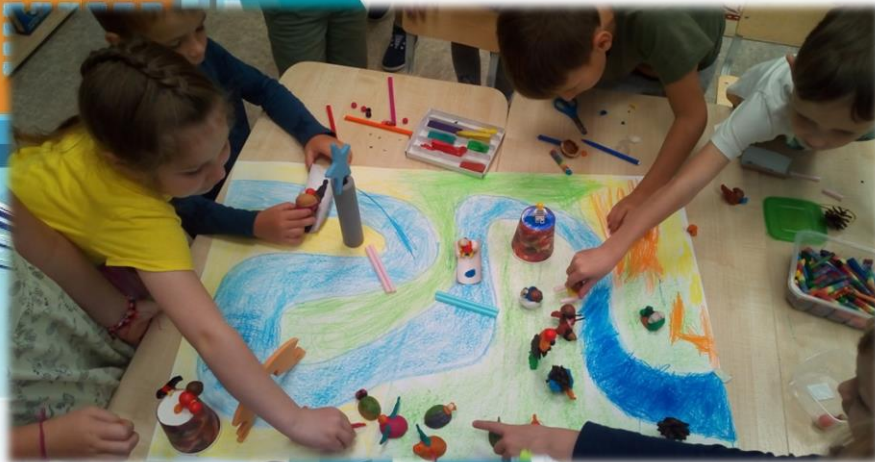
Дидактическая игра «Знатоки родного края»