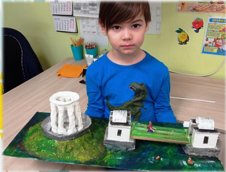
«Архитектура и памятники города Екатеринбурга»