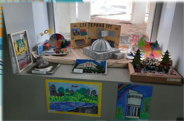
Макеты парков города