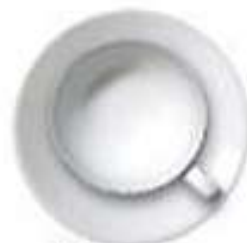
Чашка и блюдечко (десерт)