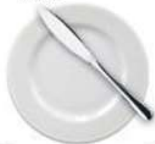
Тарелка для хлеба