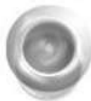
Бокал для воды