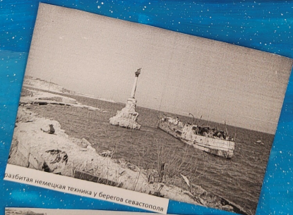
разбитая немецкая техника у берегов Севастополя