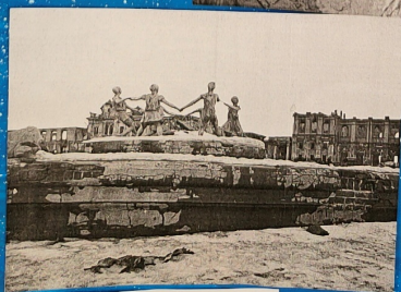
Фонтан Детский хорювод на привокзальной площади