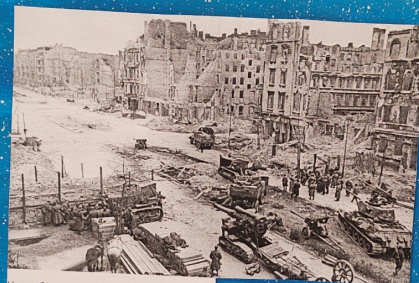
Наша бронетехника на улицах берлина