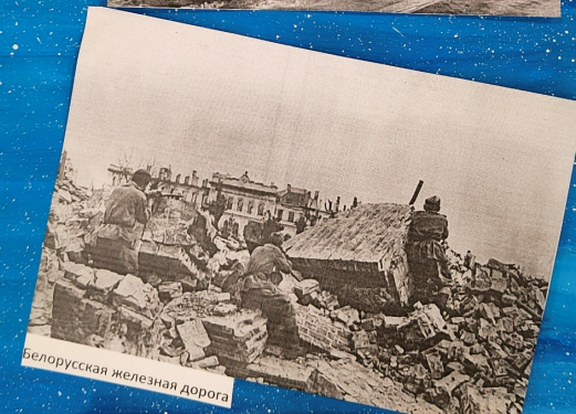
белорусская железная дорога